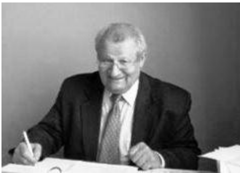
Уладзімір Мархель (1940–2013)

За апошні час па заказу і пры фінансавай падтрымцы Міністэрства інфармацыі Рэспублікі Беларусь Інстытутам літаратуразнаўства імя Янкі Купалы ажыццёўлена выданне 20-томнага Збору твораў Івана Шамякіна (2010–2015), 10-томнага Збору твораў Івана Навуменкі (2012–2017), заснавана ў 2011 г. 50-томная серыя «Залатая калекцыя беларускай літаратуры» (выйшла 20 тамоў, т. 20 «Паэзія перыяду Вялікай Айчыннай вайны» – у 2020 г.), распачата ў 2018 г. выданне 10-томнага Збору твораў Янкі Брыля.