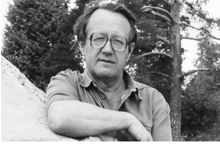
Алесь Адамовіч (1927–1994)

літаратуразнаўства, засведчыла іх навуковую сталасць. У гэтай «Гісторыі...» на вялікім фактычным матэрыяле ўпершыню шырока, грунтоўна і аб'ектыўна быў прасочаны шматвяковы, вельмі складаны шлях развіцця літаратуры на беларускіх землях, неадлучны ад лёсу народа, раскрыта вялікае ідэйна-мастацкае багацце яе здабыткаў, высокі, сапраўдны еўрапейскі ўзровень творчай спадчыны найбольш выдатных яе прадстаўнікоў.