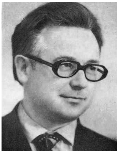
Мікола Арочка (1930–2013)

Коласа (1961–1964). Прыкметнымі вынікамі адзначана праца тэкстолагаў Інстытута; выданне больш поўных збораў твораў Я. Купалы ў 7 тамах (1972–1976); Я. Коласа ў 14 тамах (1972–1978); К. Чорнага ў 8 тамах (1972–1975); І. Мележа ў 10 тамах (1974–1985) і інш. Гэта дзейнасць стала своеасаблівай навуковай школай падрыхтоўкі нацыянальных кадраў тэкстолагаў, а яе практычныя вынікі мелі важнае навукова-асветніцкае і агульнакультурнае значэнне.