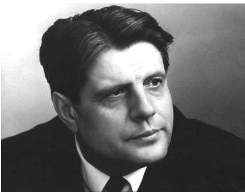
Іван Навуменка (1925–2006)

Асноўныя навуковыя напрамкі, над якімі працаваў Інстытут у пасляваенны час, – пытанні гісторыі беларускай літаратуры, беларускай лексікаграфіі, беларускага выяўленчага мастацтва ў дні Вялікай Айчыннай вайны. Былі таксама падрыхтаваныя і выдадзеныя новыя падручнікі і хрэстаматы па беларускай літаратуры дасавецкага часу, а ў пачатку 50-х гадоў з'явіліся першыя манаграфічныя працы (Ю. Пшыркова, С. Майхровіча і інш.).