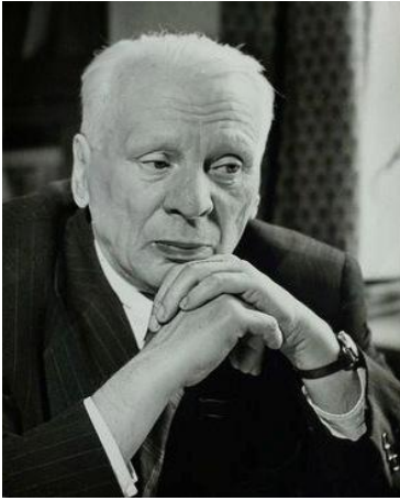
Міхась Лынькоў (1899–1975)

Інстытут літаратуразнаўства ўзнік як установа, галоўнай мэтай якой было стварэнне нацыянальнай навукі пра літаратуру, а таксама ў якасці задач абазначаны збор, тэксталагічная апрацоўка і выданне рукапіснай і архіўнай літаратурнай спадчыны ад старажытнасці да сучаснасці.